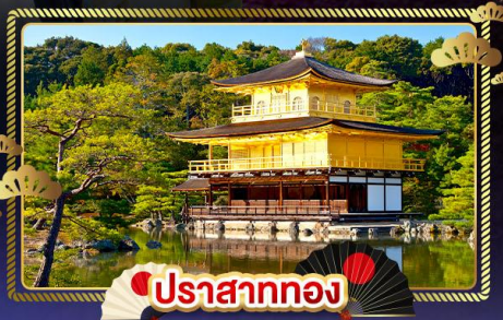
ปราสาททอง