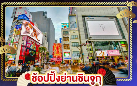
ช้อปปิ้งย่านชินจูกุ